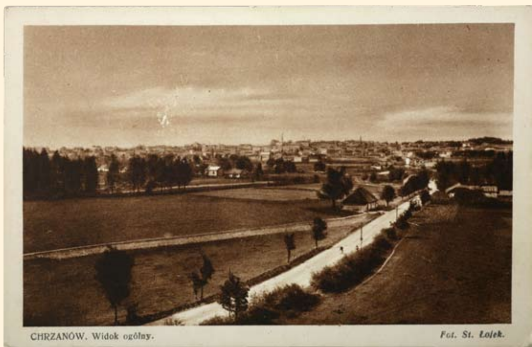
CHRZANÓW. Widok ogólny.