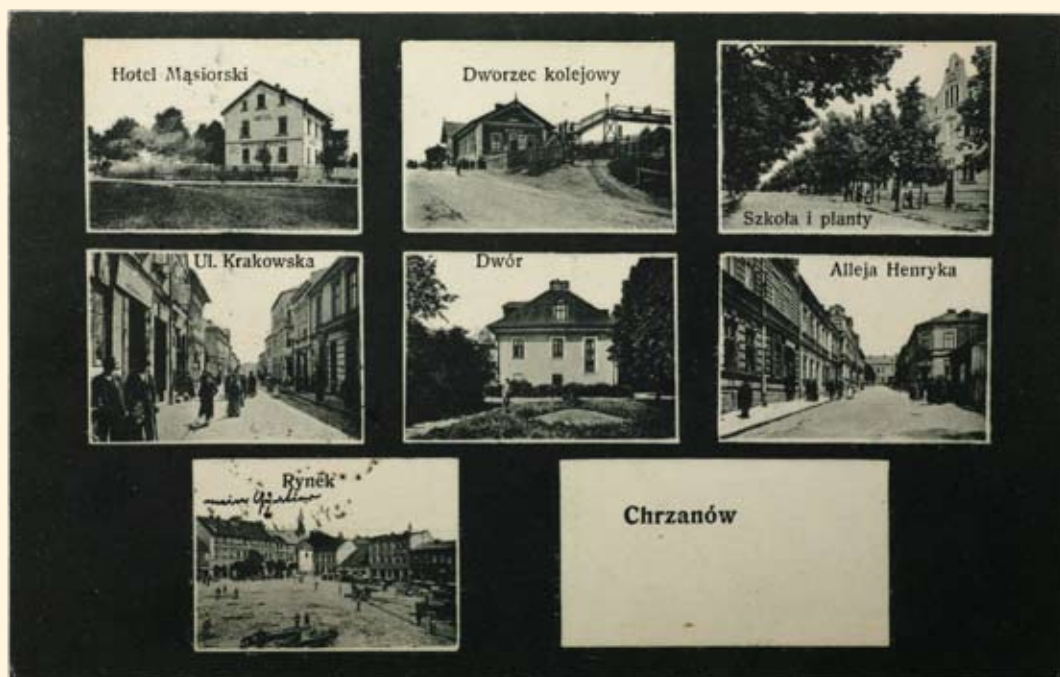
Ryc. 3 Hotel Mąsiorski przy Alei Henryka. Dworzec kolejowy. Szkoła i planty (Aleja Henryka). Ul. Krakowska. Dwór (obecnie Muzeum). Al. Henryka. Rynek. 1912 r.