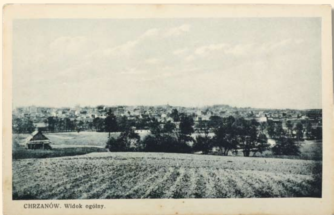
Ryc. 6 Chrzanów - widok ogólny od strony Kościelca. Ok. 1930 r.