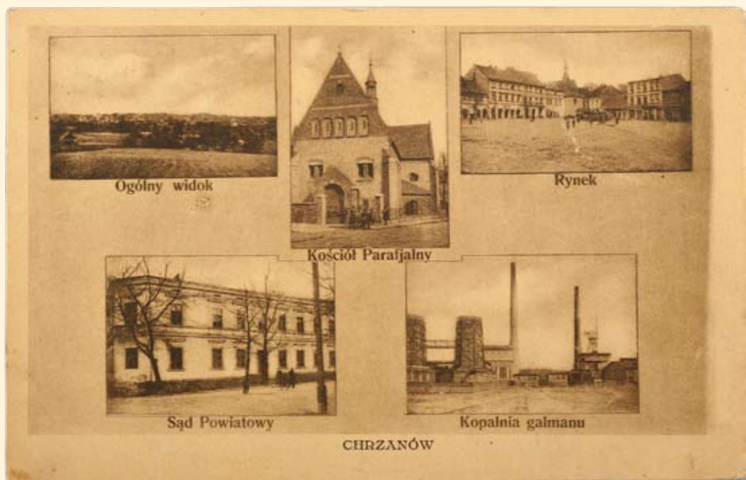
Ryc. 5 Chrzanów - widok ogólny od strony Kościelca. Kościół św. Mikołaja. Rynek. Sąd Powiatowy. Kopalnia galmanu „Matylda”. Wyd. Kazimierz Zarębski, fot. Stanisław Łojek, Chrzanów, 1930 r.