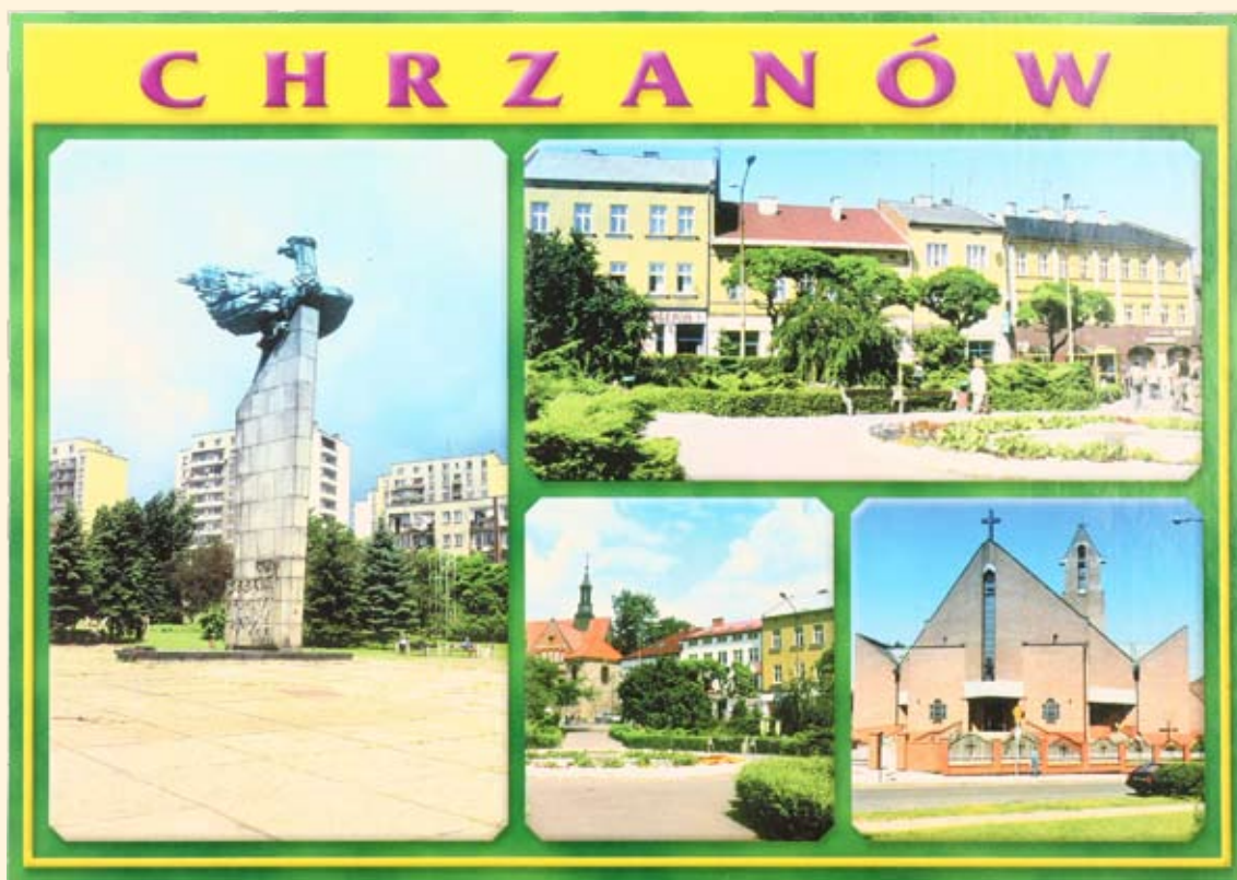
Ryc. 8 Plac Tysiąclecia - Pomnik Zwycięstwa i Wolności. Fragmenty Rynku. Kościół Matki Bożej Różańcowej. Wyd. BASTION, fot. J. Pietruszka, 2003 r.