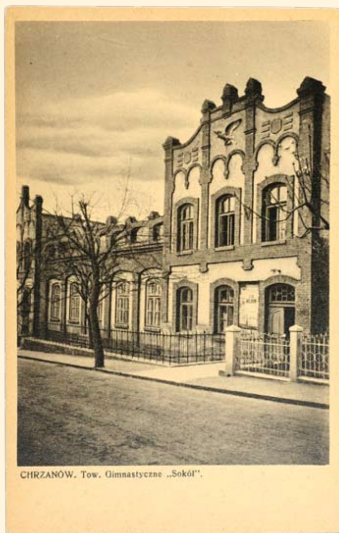
CHRZANÓW. Tow. Gimnastyczne „Sokół”.

Ryc.128 Budynek Towarzystwa Gimnastycznego „Sokół” (obecnie Hotel MOKSiR). Nakł. T.K.Ch, GGJ, 1914 r.