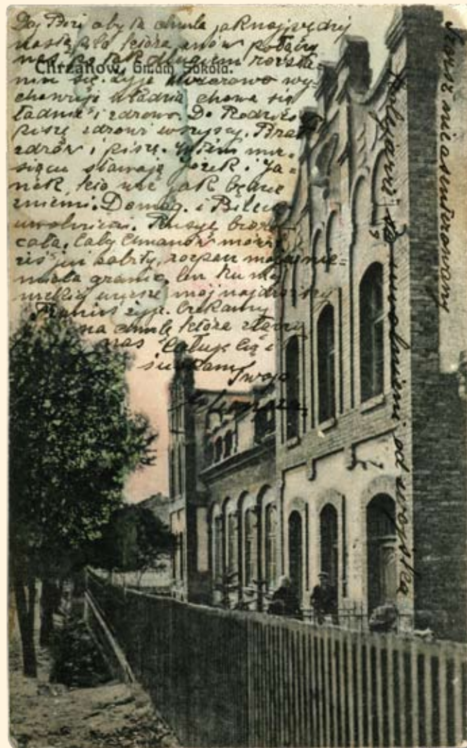
Ryc.127 Budynek Towarzystwa Gimnastycznego „Sokół” (obecnie Hotel MOKSiR). Nakł. T.K.Ch, GGJ, 1914 r.