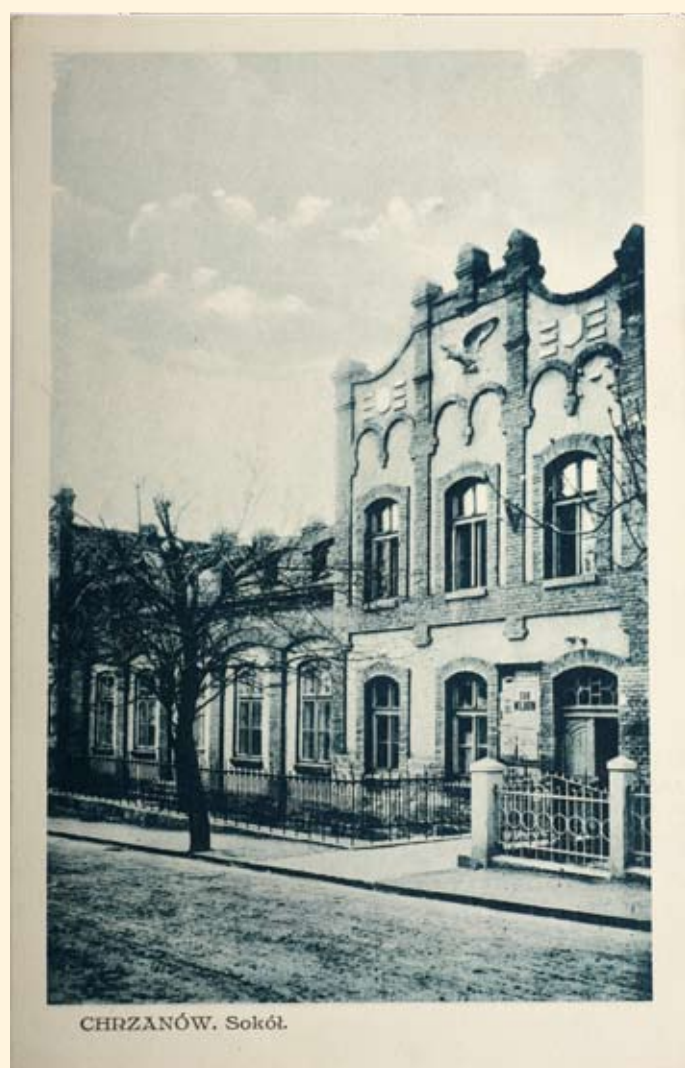
Ryc.129 Budynek Towarzystwa Gimnastycznego „Sokół” (obecnie Hotel MOKSiR). Nakł. T.K.Ch, GGJ, 1914 r.