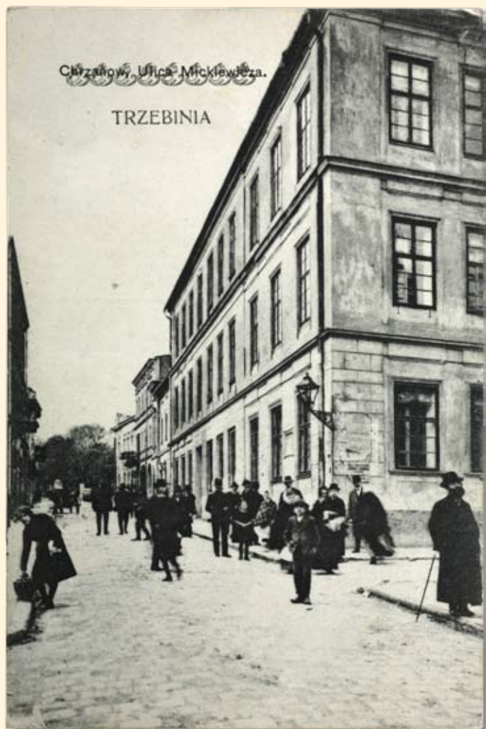
Ryc. 123 Szkoła przy ul. Mickiewicza (obecnie siedziba Towarzystwa Oświatowego Ziemi Chrzanowskiej). Nakł. T.K.Ch, GGJ, 1914 r.

The School in Mickiewicza Street (at present: offices of Educational Society of the Chrzanów Region). Publisher: T.K.Ch, GGJ, 1914.