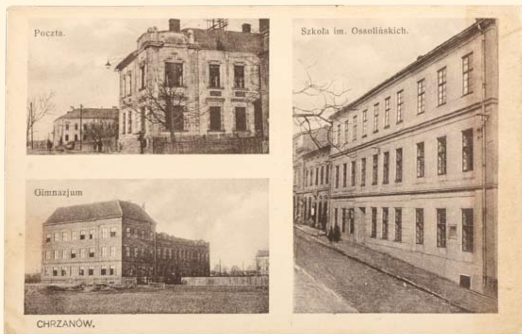
Ryc. 122 Dawny urząd podatkowy, poczta, szkoła przy ul. Mickiewicza oraz Gimnazjum im. St. Staszica. Nakł. M. Kornblum. Wydaw. Zakłady Reprodukcyjne „AKROPOL” . Kraków XXII, 1920 r.