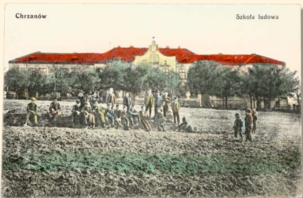
Ryc. 121 Szkoła przy Alei Henryka (obecnie Szkoła Podstawowa Nr 3 i Publiczne Gimnazjum Nr 3) . Nakł. B. Landerer w Chrzanowie, 1914 r.