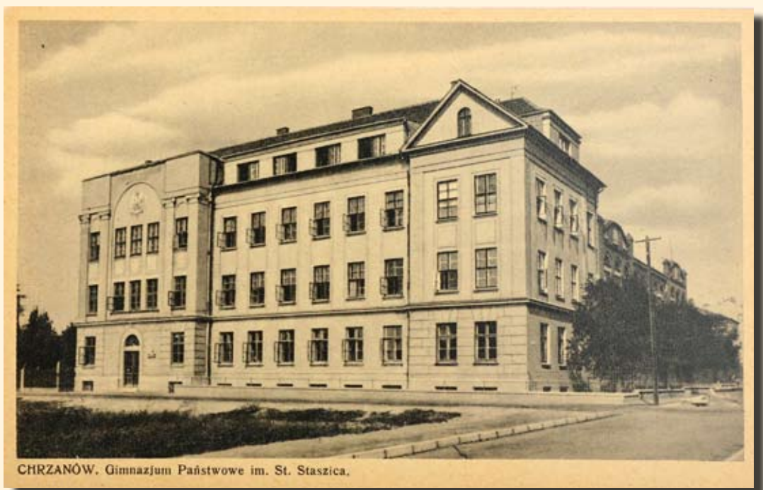
Ryc.118 Gimnazjum (obecnie I LO im. Stanisława Staszica). Wyd. Kazimierz Zarębski, Chrzanów, 1930 r.