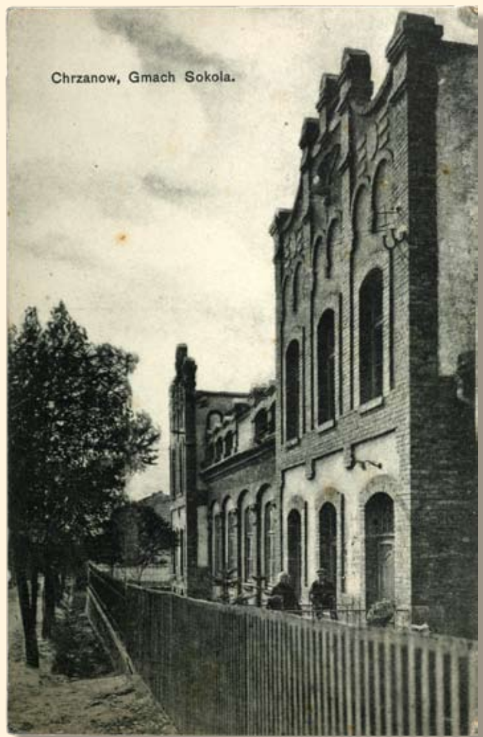
Ryc.126 Budynek Towarzystwa Gimnastycznego „Sokół” (obecnie Hotel MOKSiR). Nakł. T.K.Ch, GGJ, 1914 r.

The building of „Sokół” Gymnastic Society (currently the MOKSiR Hotel). Publisher: T.K.Ch, GGJ, 1914.