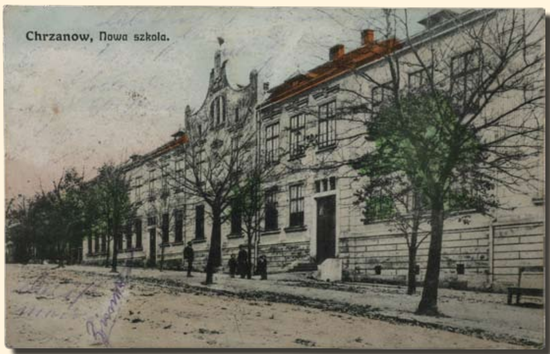
Ryc.120 Szkoła przy Alei Henryka (obecnie Szkoła Podstawowa Nr 3 i Publiczne Gimnazjum Nr 3). Nakł. T.K.Ch, GGJ, 1914 r.

The School in Henryka Avenue (at present Primary School No 3 and Public Grammar School No 3). Publisher: T.K.Ch, GGJ, 1914.