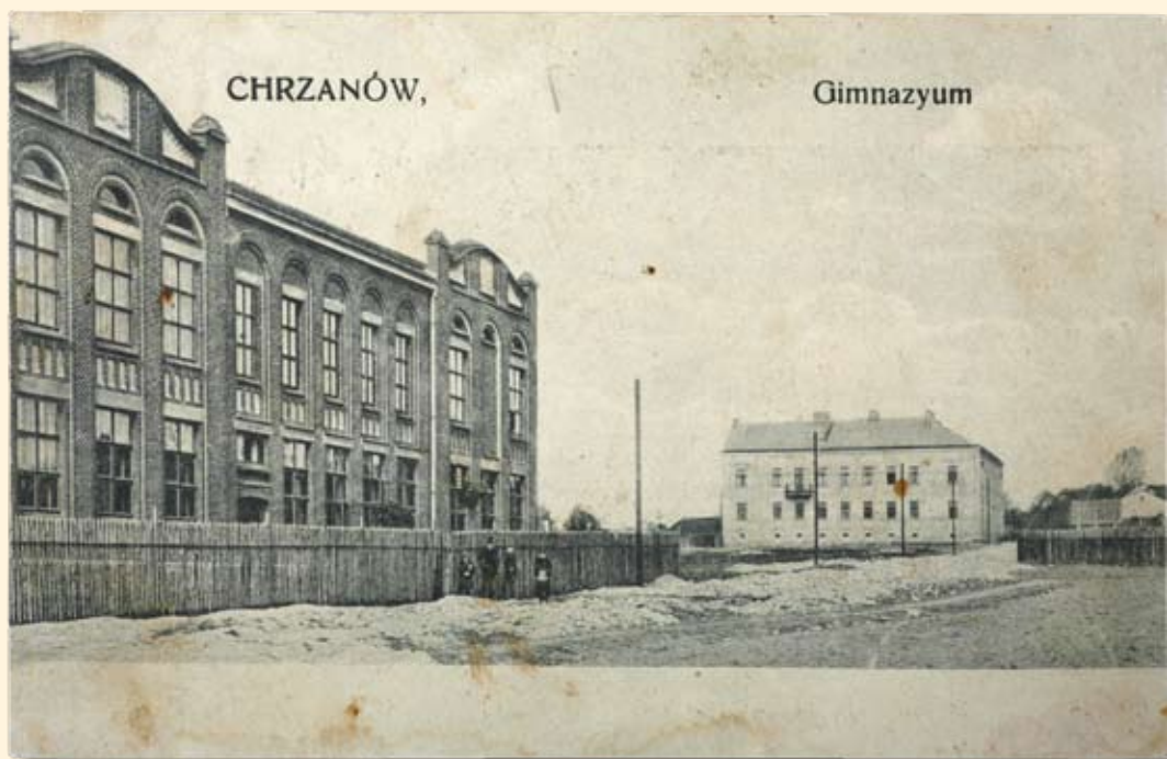
Ryc.115 Gimnazjum (obecnie I LO im. Stanisława Staszica). Nakł. T.K.Ch, GGJ, 1914 r.

Secondary School (currently St. Staszic Secondary School no.1). Publisher: T.K.Ch, GGJ, 1914.