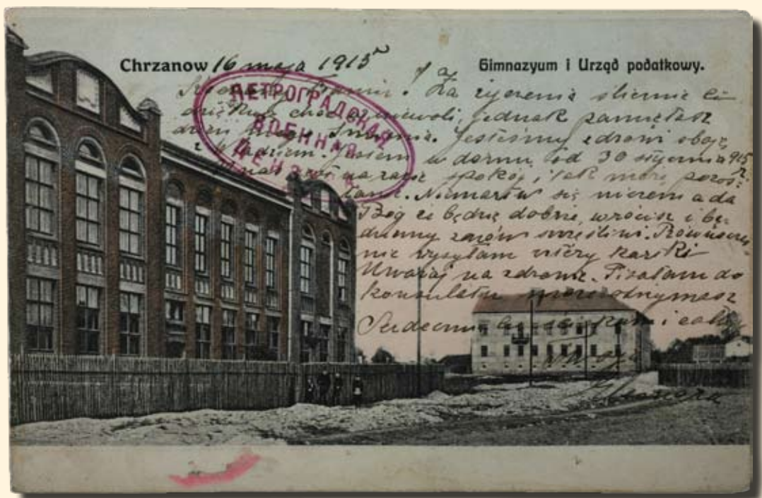
Ryc.117 Gimnazjum (obecnie I LO im. Stanisława Staszica) w tle były Urząd podatkowy.